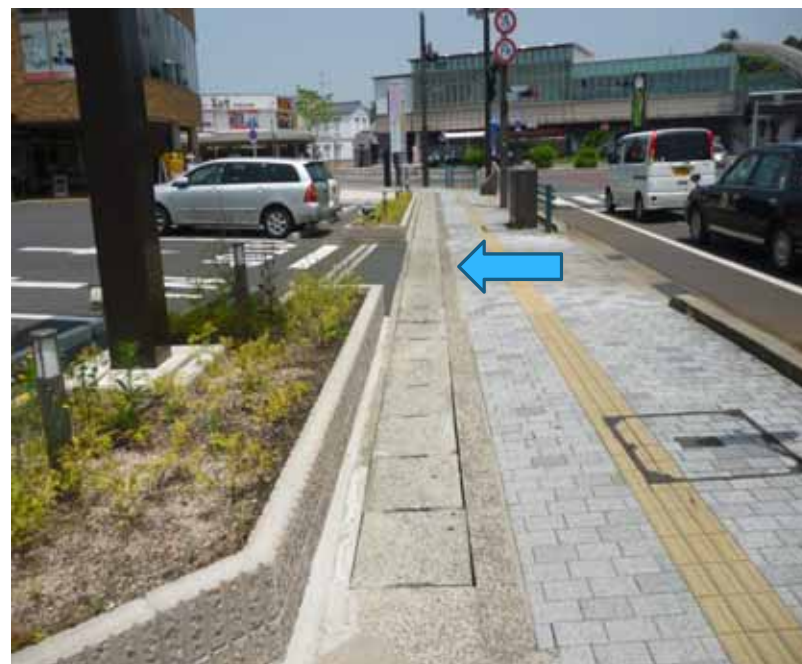
大型商業施設の出入り口・着工前