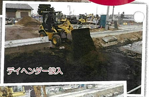
デイヘンダー投入