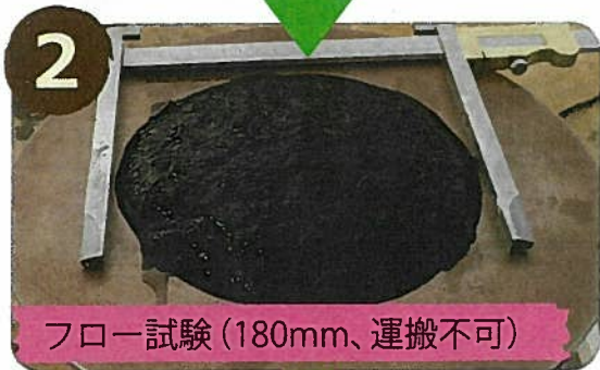
フロー試験 (180mm、運搬不可)