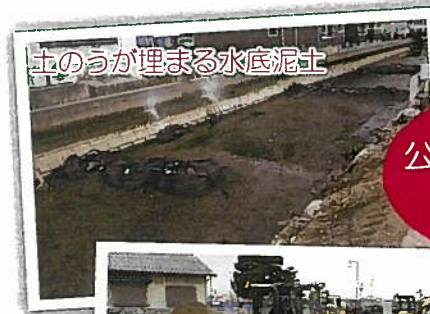
土のうが埋まる水底泥土