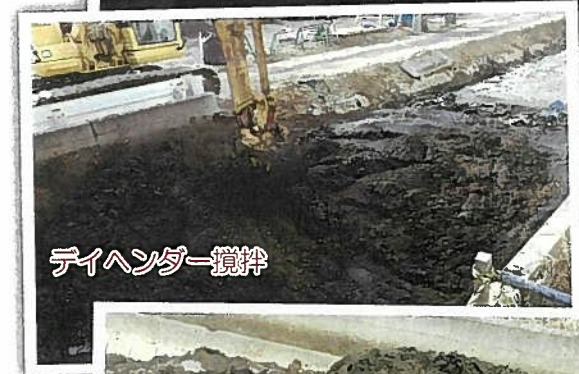
デイヘンダー攪拌