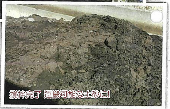
攪拌完了 運搬可能な土砂に!