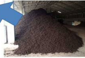
国産広葉樹バーク 30%